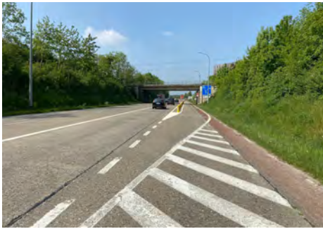
Sortir vers l'entrée N3 Haspengouwlaan