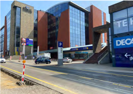
Entrée N3 Tiensesteenweg